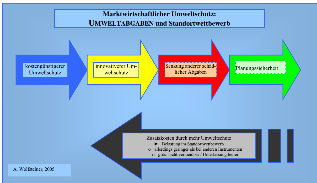
Abbildung 6: Umweltabgaben und Standortwettbewerb

An einer gewissen Schwelle überwiegen aber auch hier die negativen ökonomischen Folgen isolierter nationaler Anstrengungen in der Umweltpolitik. Preise für fossile Energien, wie sie langfristig ökologisch notwendig wären, sind im nationalen Alleingang nicht umsetzbar. Die Klimafolgen sind letztendlich nur zu begrenzen, wenn die gesamte Weltgemeinschaft mitzieht. Die Industrieländer haben dabei auf Grund ihres Know-Hows und ihres überproportionalen Anteils an den Treibhausgasen die Verantwortung in Vorlage zu gehen.